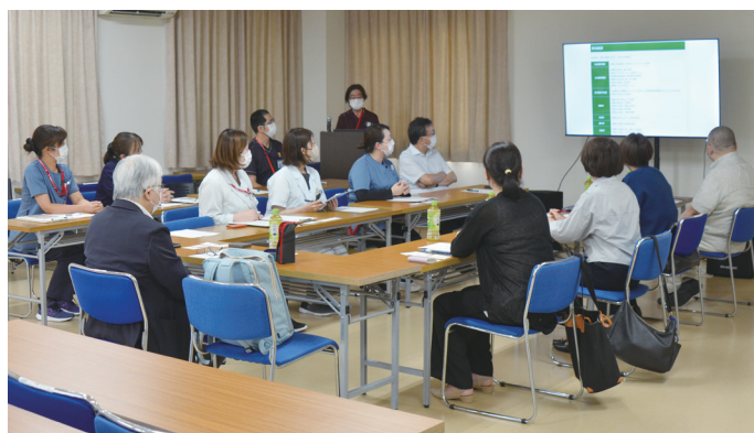
認知症対応病院ピアレビュー様子

ピアレビューで得た知見を今後の診療に活かし、地域の皆様のお役に立てるよう、さらに尽力してまいります。