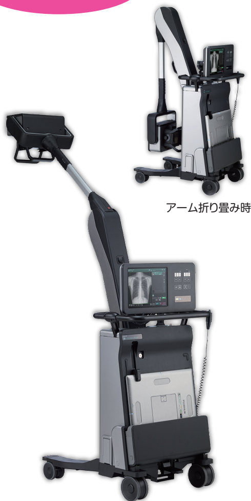
アーム折り畳み時

当院では、患者さまの安心・安全・負担軽減を大切にし、最新の医療機器を活用した質の高い医療の提供に努めています。